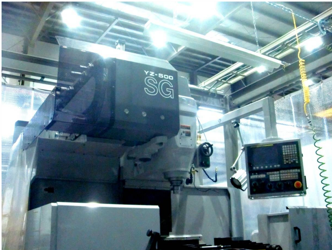
NCフライス盤 (山崎技研 YZ-500SGATC)