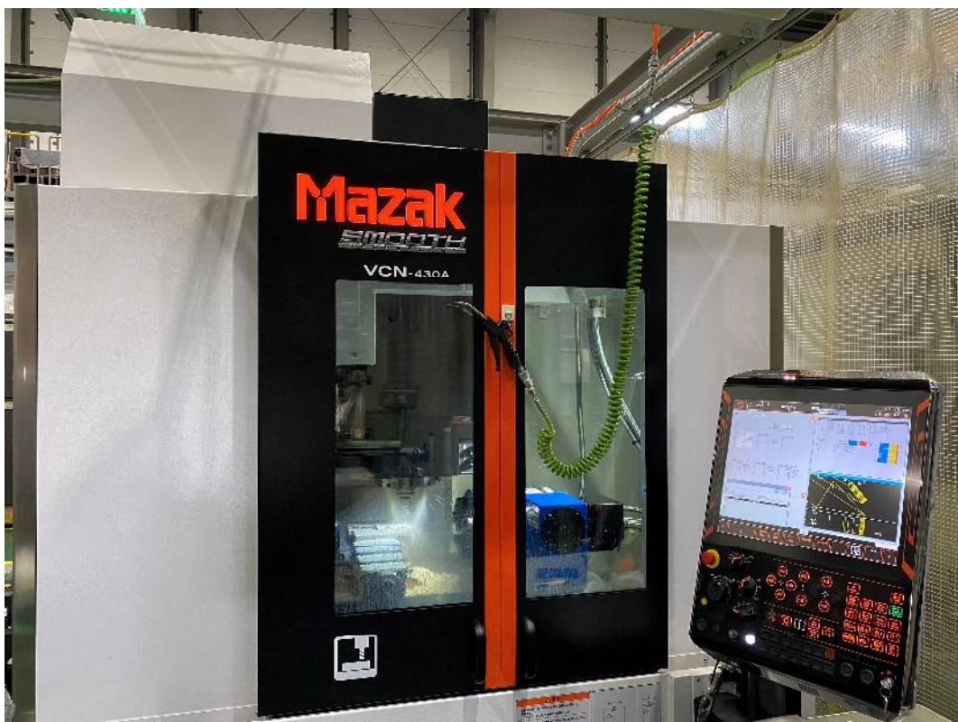
マシニングセンタ(マザック VCN-430A)