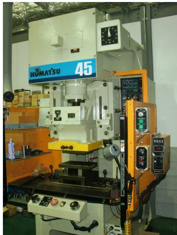
プレス (コマツ OBS-45-3B)