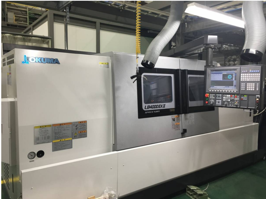
CNC 旋盤 (オークマ LB4000EX II)