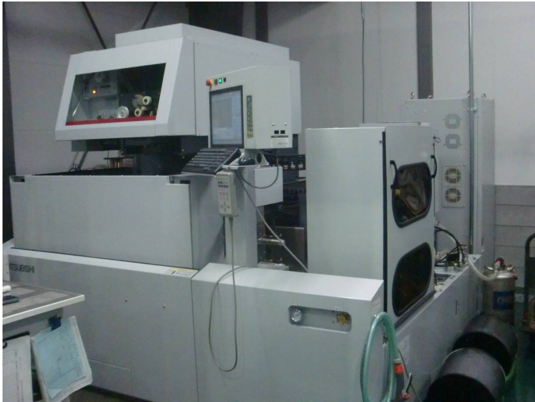
ワイヤー放電加工機(三菱 MV2400S)